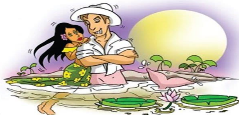
Boto Cor de Rosa