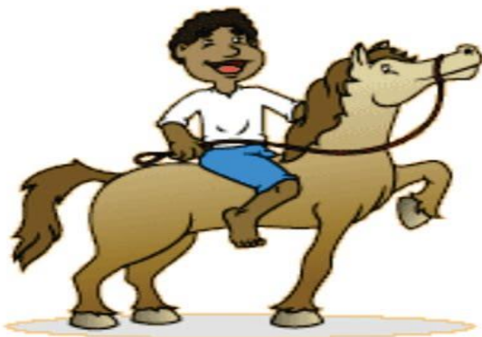
Negrinho do Pastoreiro