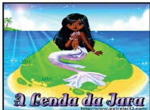
A Lenda da Jara