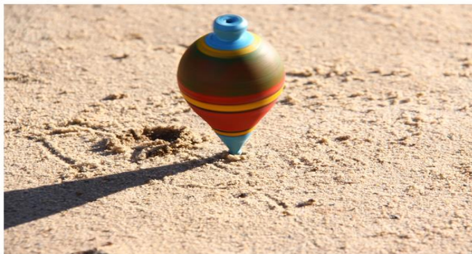
Pião, um dos brinquedos mais populares