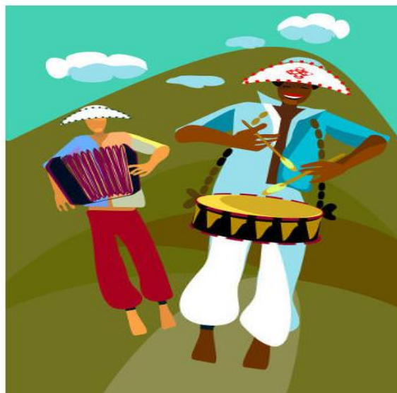
O baião é uma das manifestações mais conhecidas da cultura popular brasileira na música.