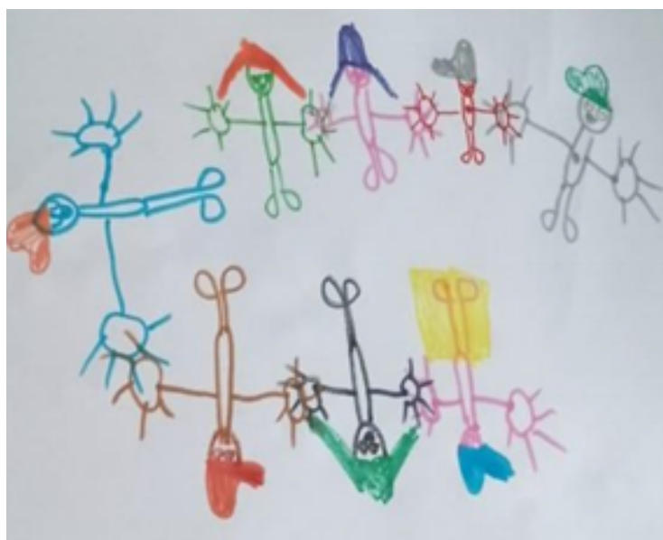
Desenho realizado por Jorge Lucas - 7 anos