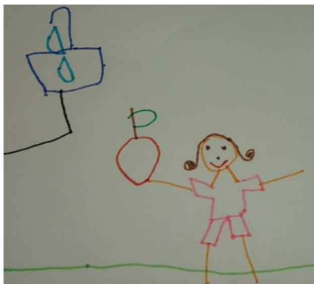
Desenho realizado por Sara Maria - 7 anos

Lavar os alimentos antes de comê-los - O cuidado na higienização dos alimentos é um procedimento muito importante, pois alimentos manipulados de forma inadequada podem ser grandes transmissores de doenças.