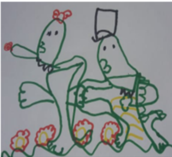
Desenho realizado por Sara Maria-

A contação de causos é uma outra possibilidade.