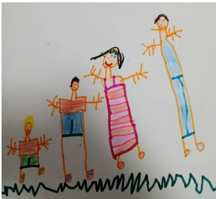
Desenho realizado por Guilherme Franco Pereira- 5 anos