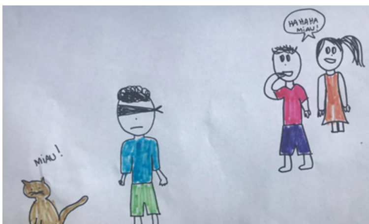
Desenho realizado por Manuela Climaco- 14 anos