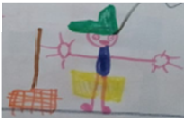
Desenho realizado por Jorge Lucas- 7 anos