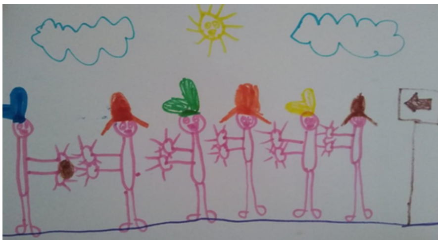
Desenho realizado por Jorge Lucas - 7 anos