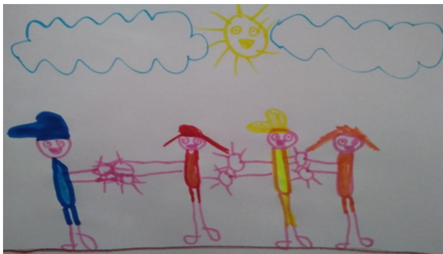
Desenho realizado por Jorge Lucas Antero Silva- 7 anos