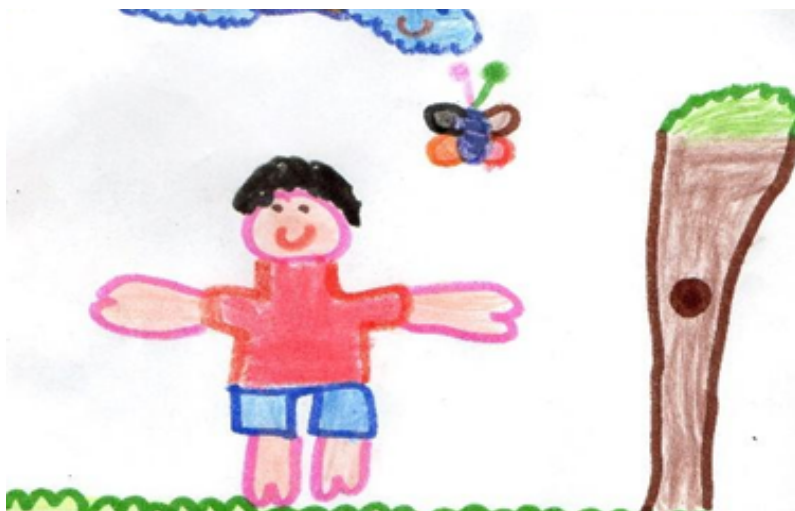
Desenho realizado por Gustavo Henrique-5 anos

Esperamos que essas práticas ajudem vocês a fortalecer os vínculos familiares conhecendo-se, convivendo, brincando, participando, explorando e expressando.