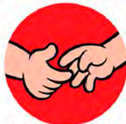
Aperto de mãos