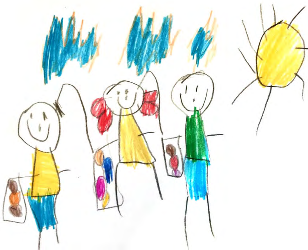
Desenho realizado por Júlia Scalabrini - 6 anos