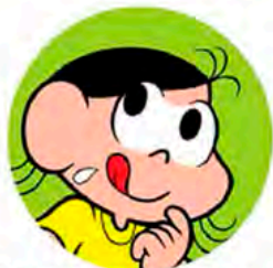
Gotinhas de saliva

O coronavírus pode ser transmitido de uma pessoa doente para outra, mesmo que não estejam muito próximas (cerca de 2 metros), por meio de: