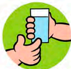
Toque em objetos ou superfícies contaminadas