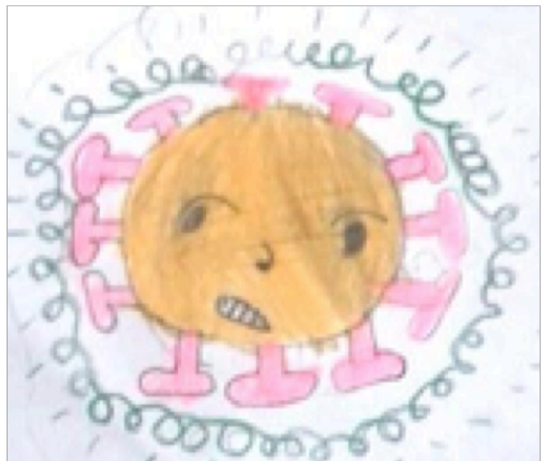
Desenho realizado por Mateus Reiser — 6 anos

Vai agora um recadinho muito especial: Não levar as mãos nos olhos, no nariz e na boca, evitando assim a contaminação por COVID-19.