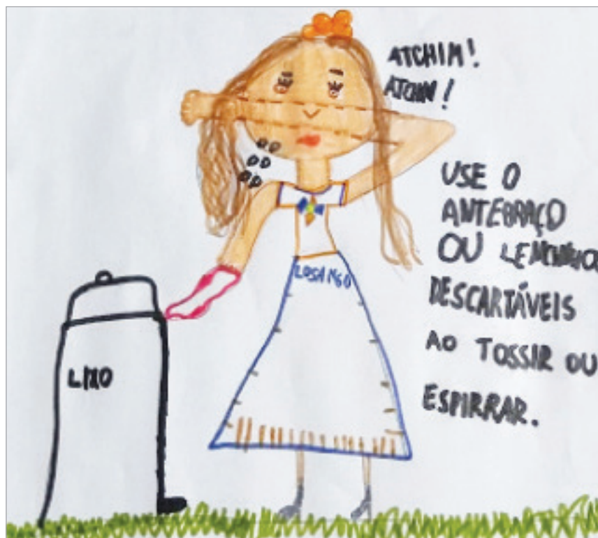
Desenho realizado por Helena Pinheiro- 5 anos