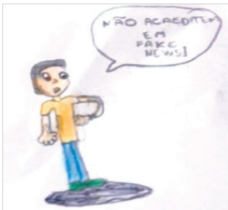
Desenho realizado por Mateus Reiser- 6 anos

Ah! Não podemos deixar de falar: NÃO acreditem em todas as informações que circulam por aí... siga sempre o site oficial da Secretaria Estadual de Saúde!