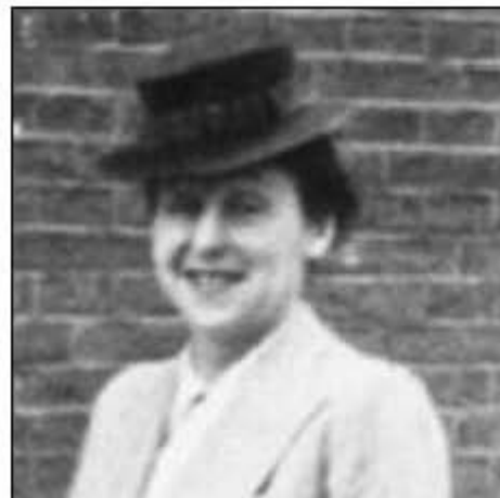
Auguste van Pels