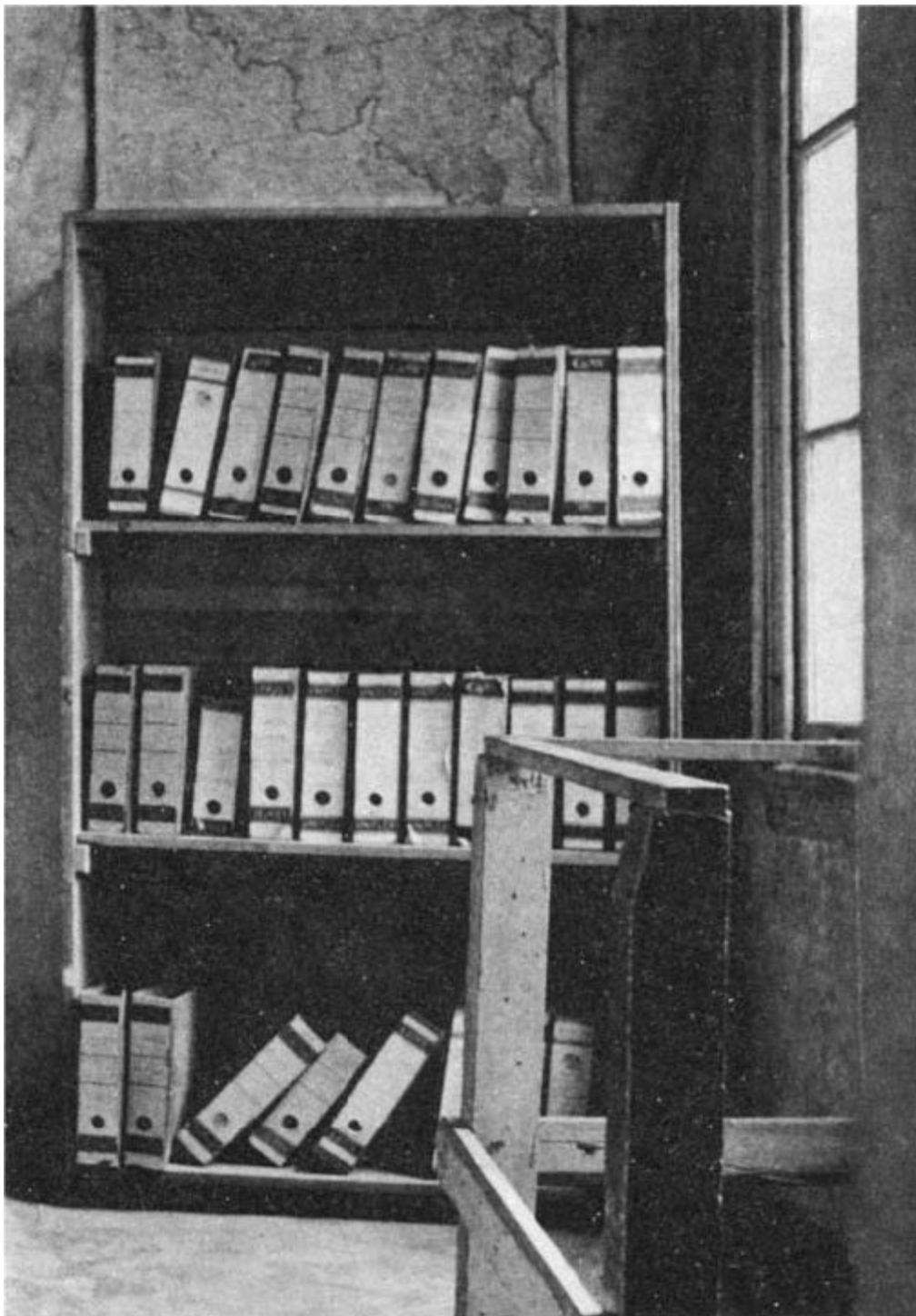
A entrada do Anexo Secreto é disfarçada por uma estante móvel.