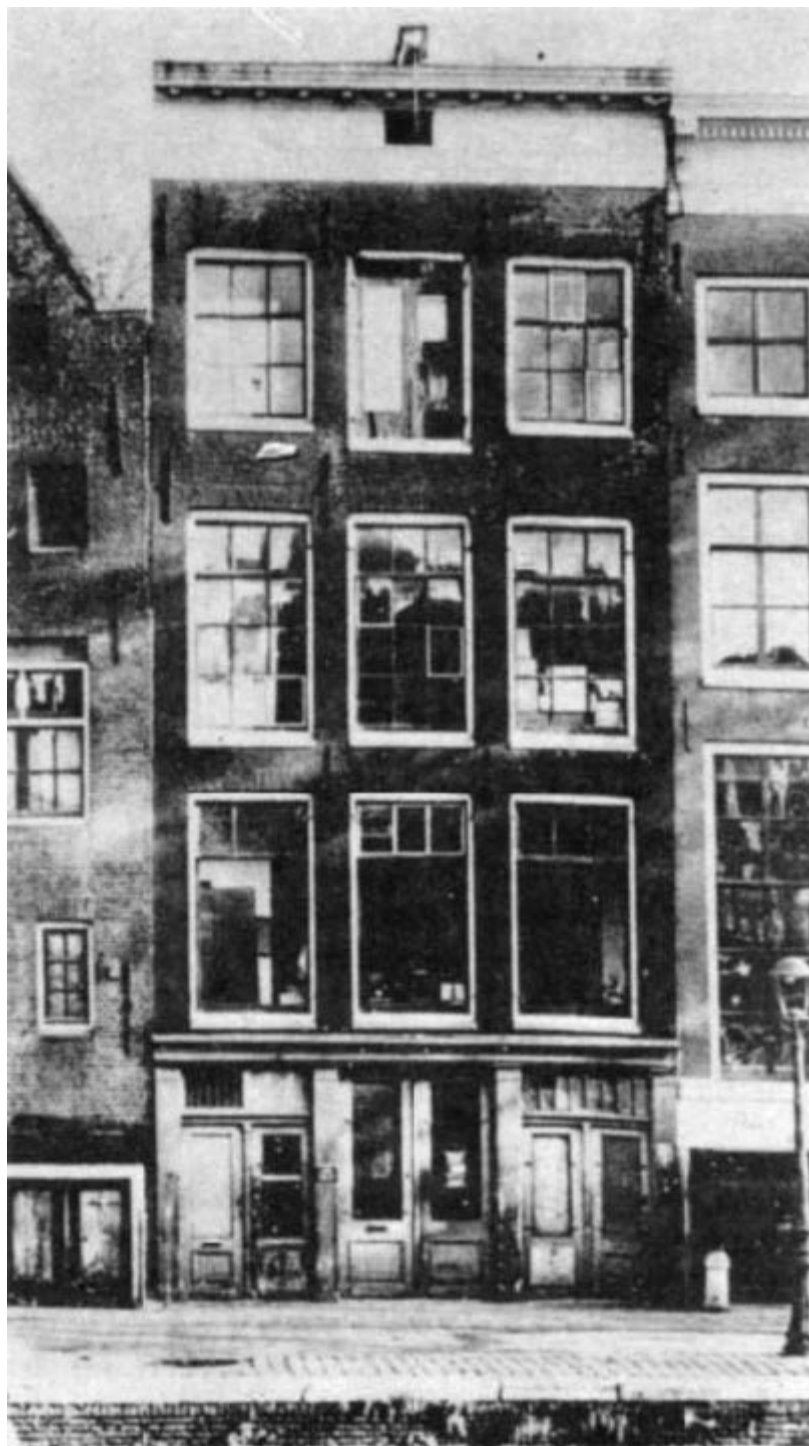
O prédio de escritórios no qual Anne Frank e sua família viveram escondidos de 1942 a 1944.