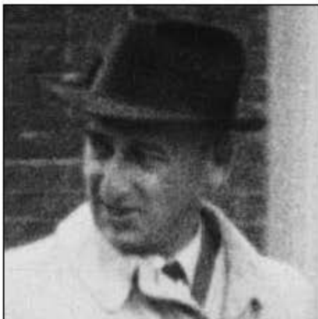
Hermann van Pels