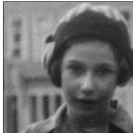
Hanneli Goslar (Lies)